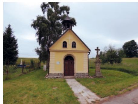
Kaple ve Stržetězi s informační tabulí vlevo od vstupních dveří.

Autory textu jsou zkušení pracovníci Muzea Podkrkonoší v Trutnově, Mgr. Vlastimil Málek a Mgr. Ondřej Vašata, kteří shromáždili k většině památek informace dosud ukryté ve starých a ne v úplnosti excerpovaných archivních dokumentech. Tak se i Trutnované mohou dozvědět nové informace o památkách, kolem kterých dennodenně chodí.