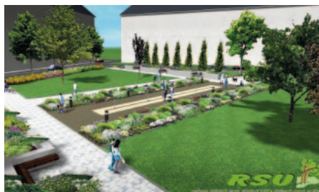
Projekt „Regenerace zeleně a veřejných ploch Jiráskova náměstí v Trutnově“ Zpracovatel: RSU s.r.o. Trutnov (2014)

na tříděný odpad, které nahradí stávající odpadové nádoby umístěné na chodníku před samoobsluhou. Po dokončení stavby se předpokládá zřízení Free Wifi Hotspot pro možnost připojení na internet.